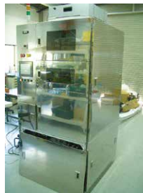
薄膜スプレイコーター