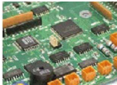
輸出の際に必要な UL 規格適合品、Rohs 対応ハンダ付けが可能