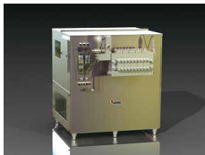
H120 型ホモゲナイザー