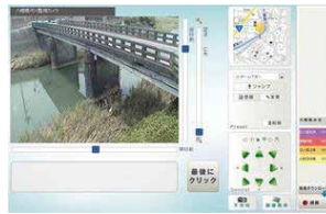
「監視カメラシステム」