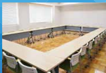
■中会議室(机・イス有36人程度) 1時間/600円 広さ64㎡×4室