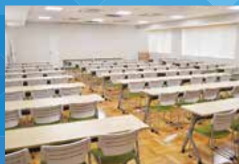
■大会議室(机・イス有100人程度) 1時間/1500円 広さ161㎡×1室