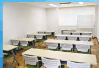
■小会議室(机・イス有20人程度) 1時間/300円 広さ32㎡×4室