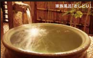
家族風呂「おしどり」

50分@1000円(税別)の 家族風呂「おしどり」が 1回無料でご利用いただけます。 1泊 ¥23,760~ ☎ 0558-72-0260 ▲ 伊豆市修善寺1146-6