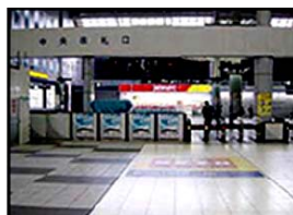
① JR品川駅の中央改札口を出ます。正面にプリンスホテルの案内看板があります。

Shinagawa Prince Hotel 品川プリンスホテル 〒108-8611 東京都港区高輪4-10-30