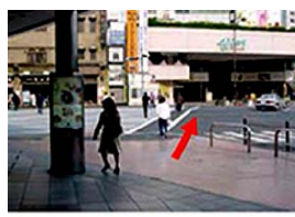
④ 矢印の方向へ横断歩道を渡ります。ウィング高輪へ入り、斜め左方向に進みます。