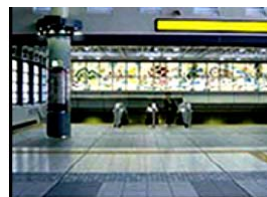
② 改札口を出たら左の階段(高輪口)を降ります。