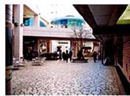
⑤ ウィング高輪の中庭へ出ると、正面にNタワーが見えます。