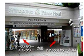
⑥ 右矢印がアネックスタワー1F入口です。アーチを抜けて左矢印を進むと正面にメインタワー入口が見えてきます。